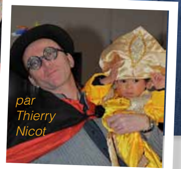
par Thierry Nicot

La tempête a effectivement découragé plusieurs familles mais nous étions tout de même un peu plus de 90 personnes -petits et grands- ! Et pour nous ennuyer un peu plus, une panne d'électricité a duré toute l'après-midi mais c'était sans compter sur l'efficacité du papa de Rachel pour nous apporter un groupe électrogène qui nous a permis de suivre le spectacle du clown, ainsi que la présentation de tous les enfants déguisés et la sculpture des ballons. Avant tout cela, des mamans ont maquillé les enfants et d'autres ont pu confectionner quelques chapeaux de princesses ! Les enfants ne se sont pas aperçus de toutes ces péripéties techniques. Leurs regards en disaient long sur la magie du spectacle et toute l'ambiance qui régnait ! Merci à tous. Rachel et Anne