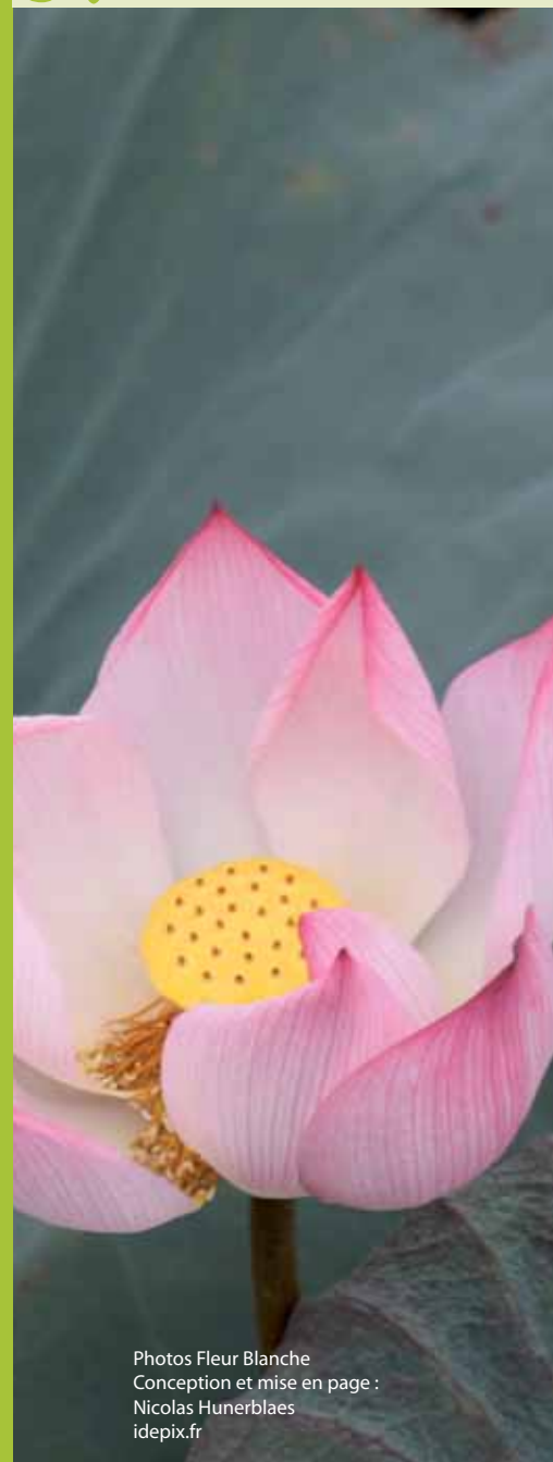
Conception et mise en page : Nicolas Hunerblaes idepix.fr