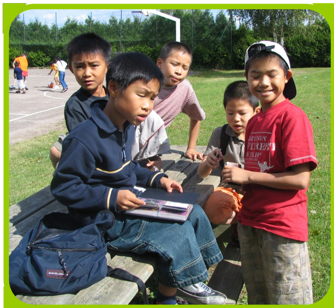
Une journée magnifique pour apprécier jouer ensemble aussi bien dehors que dedans